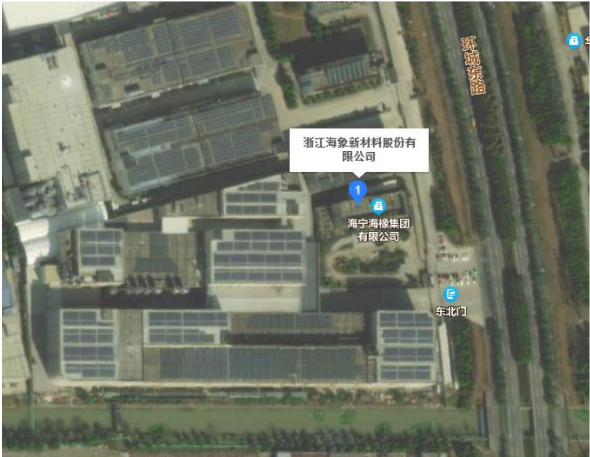
图3-4 企业核算地理边界图

经现场确认的地理边界为：浙江省海宁市海昌街道海丰路380号。厂区温室气体排放核算地理边界图如下：